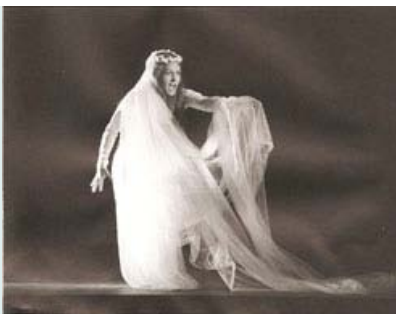
Foto de archivo de una presentación de esta ópera, la cual será representada en el Auditorium Juan Bautista Gutiérrez de la Universidad Francisco Marroquín.

Lucia di Lammermoor, ópera en tres actos compuesta por Gaetano Donizetti y basada en hechos reales que ocurrieron en la Escocia del siglo XVI, será presentada por la Organización para las Artes de la Universidad Francisco Marroquín los días jueves 9 de octubre a las 19:30 horas y sábado 11 del mismo mes a las 18:00 horas en el Auditorium Juan Bautista Gutiérrez.